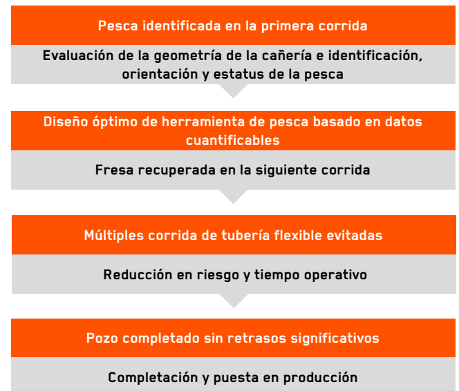
Figure 3: Datos producidos por el servicio FishVA ahorran costos adicionales y ayudaron a completar el pozo sin mayores retrasos